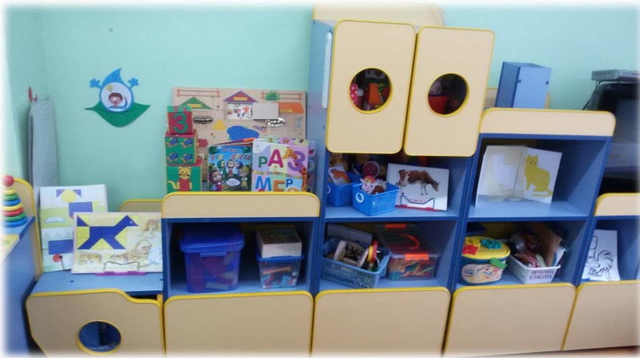
открытые и низкорасположенные полки