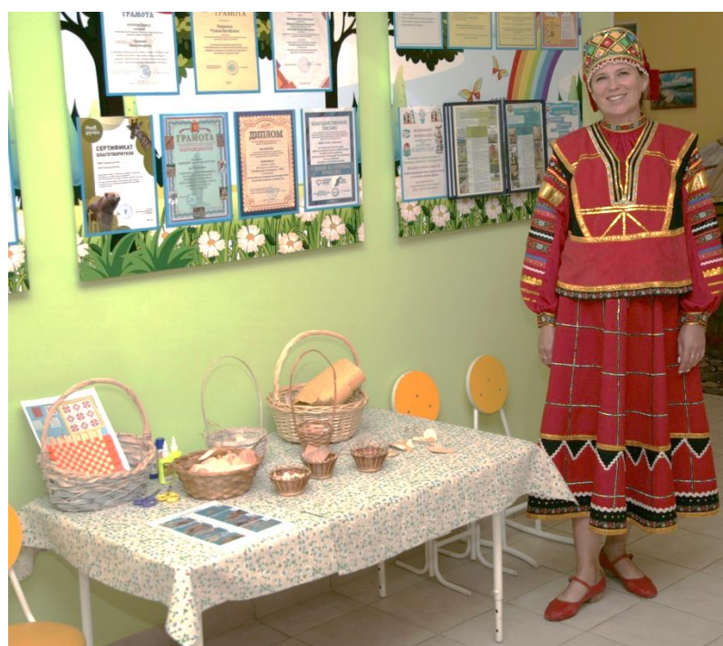
Творческая мастерская «Сувенир из бересты»