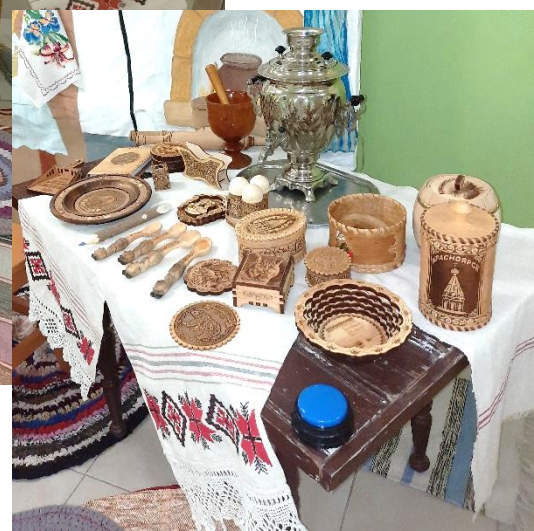
Коллекция берестяных изделий и интерактивная аудиокнопка