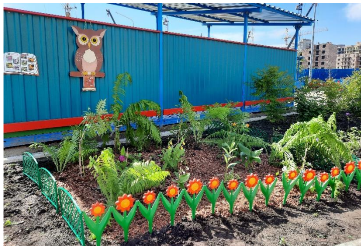
Пространство «Злаковое поле».

Эко-пространство «Красная книга» создано для возрождения познавательного и практического интереса у детей, родителей и педагогов к дикорастущим цветам. Пространство оснащено информационным стендом в виде разворота Красной книги, который содержит информацию о растениях, произрастающих на эко клумбе, а также QR-коды со специально разработанными для данной площадки авторскими видеороликами: «Детям о Красной книге», «Легенды о венерином башмачке», «Легенды о кукушкиных слезках», «Легенды Сон-травы», «Легенды о жарках», «Лилия кудреватая», «Придания о лилейнике», «Легенды и истории о ландышах»